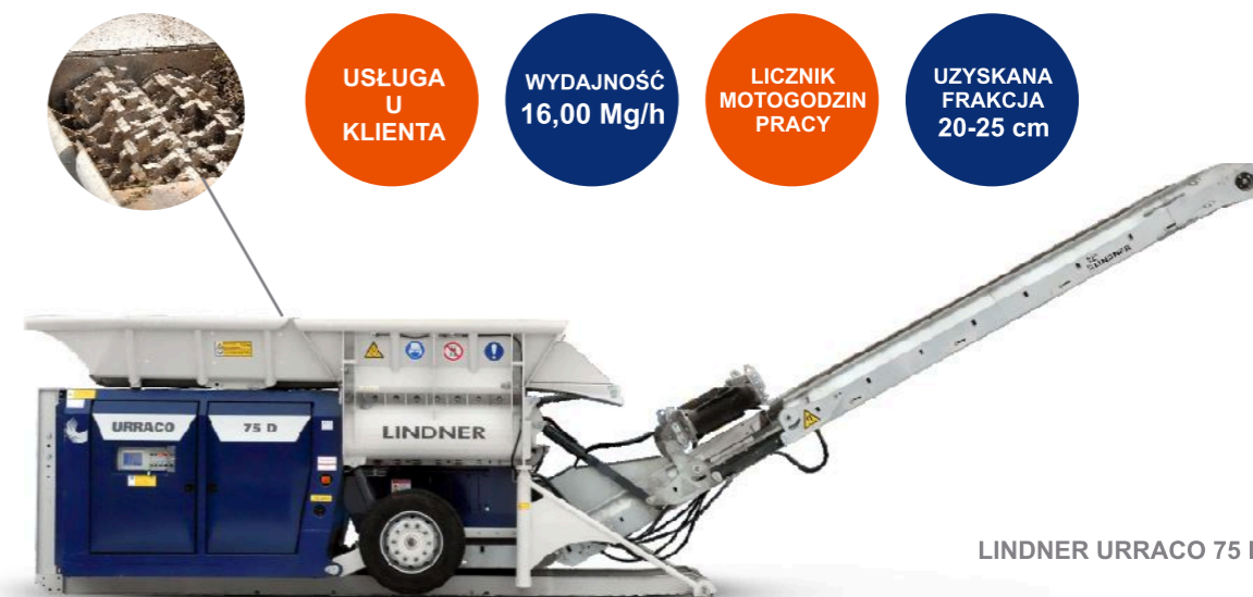
LINDNER URRACO 75 D